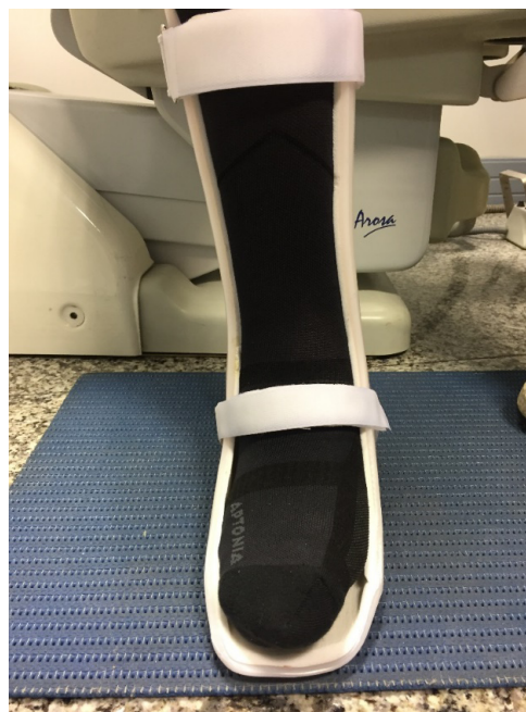
Figura 7. Férula AFO que el paciente comenzó a utilizar a los 4 meses de la intervención.