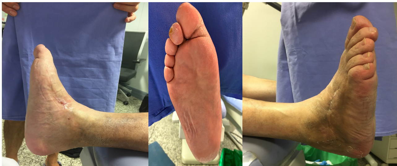
Figura 8. Imágenes posoperatorias al año de la intervención.