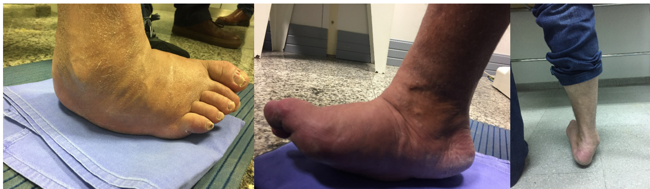
Figura 1. Imágenes preoperatorias del paciente.