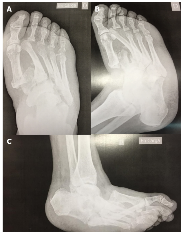
Figura 2. A: radiografía AP en carga. B: Rx oblicua. C: RX lateral en carga.

te no presentaba ulceraciones, pero tanto en bipedestación estática como en dinámica se observaba hiperpresión en la zona del cuboides por la gran deformidad que presentaba.