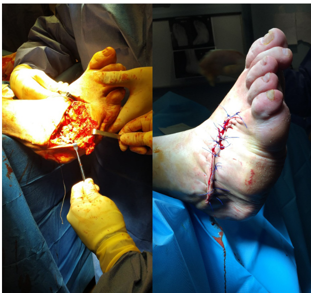
Figura 4. A: abordaje abierto por medio de incisión lateral. B: imagen después de sutura.

El paciente permaneció un día ingresado, y como pautas posoperatorias se recetó tratamiento antibiótico mediante amoxicilina/ácido clavulánico 875/125 (Augmentine®, GSK, España) cada 8 horas durante 7 días, dexketoprofeno trometamol (Enantyum®, Menarini, España) cada 8 horas durante 14 días, omeprazol 20 mg cada 24 h durante 14 días y enoxaparina sódica 4000 UI (40 mg)/0,4 ml (Clexane®, Sanofi, España) cada 24 horas durante 12 semanas, ya que el paciente permaneció en descarga absoluta durante dos meses, seguido de carga parcial durante un mes.