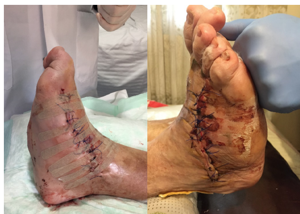
Figura 6. A: imagen a las 24 h de la intervención. B: imagen a los 15 días de la intervención.