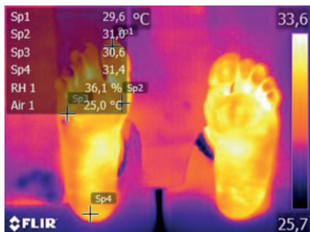
Figura 2. Termografía plantar del pie. Señalizados puntos en primer dedo, cabeza del primer metatarsiano, cabeza del quinto metatarsiano y talón.

Todos los valores de temperatura presentaron una significación superior a 0.05 (Tablas II y III), esto indica que los datos estaban distribuidos normalmente. Por ello, se aplicaron pruebas estadísticas paramétricas.