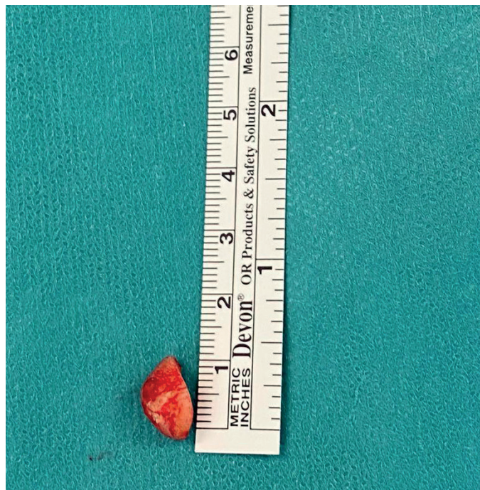
Figura 4. Medición de la lesión antes de su envío a anatomía patológica.