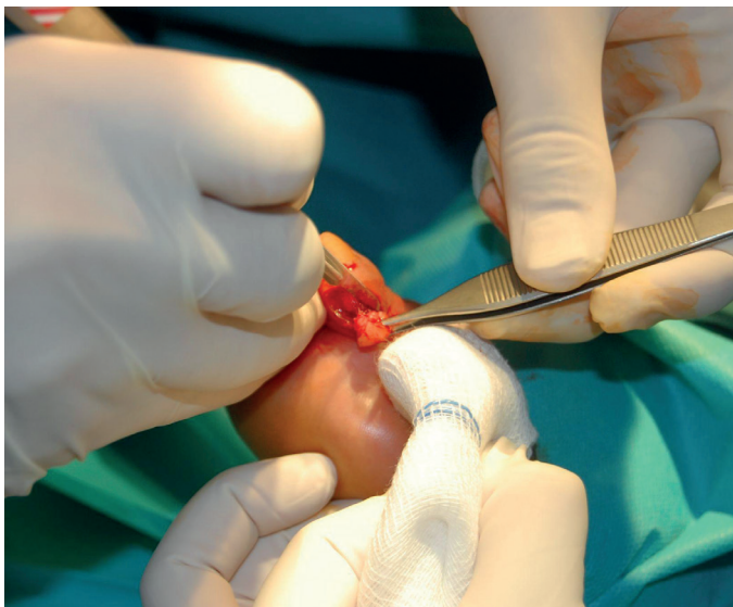
Figura 3. Escisión del nódulo reumatoide.