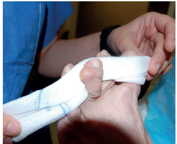
Figura 1. Visión de la lesión nodular en el tercer dedo del pie izquierdo.

Una vez realizada la exploración, y valorando los datos de la paciente (antecedentes de AR y lupus eritematoso), el diagnóstico inicial fue de nódulo reumatoide.