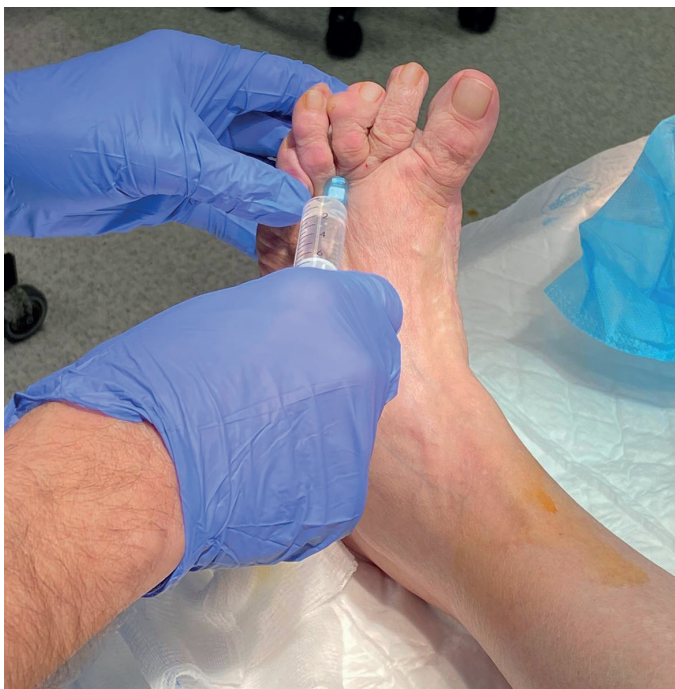
Figura 2. Bloqueo anestésico en la base del tercer dedo del pie izquierdo.