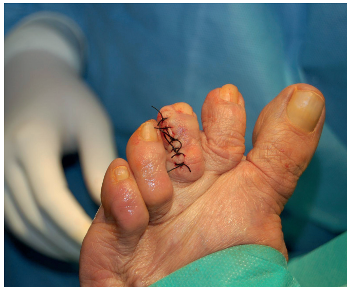
Figura 5. Sutura de la incisión con seda trenzada no absorbible.

área central de aspecto quístico con disrupción y presencia de células necróticas epiteliales y sustancia eosinófila compatible con queratina (Figura 6).