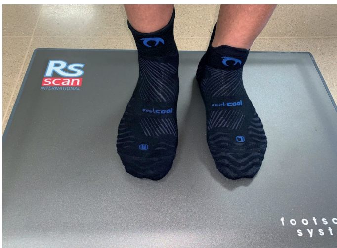
Figura 1. Modelo AWC 1 en pie izquierdo y AWC 2.1 en pie derecho.