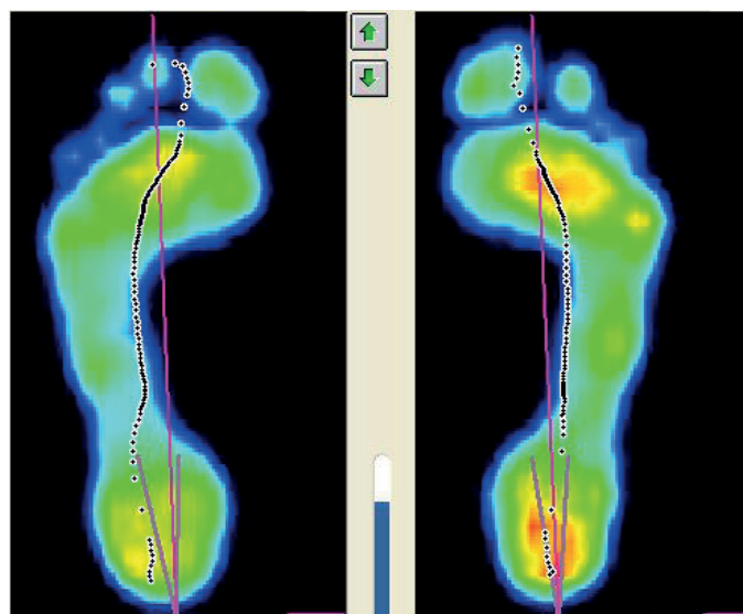
Figura 5. Mapa de presiones tras la carrera con calcetín AWC 2.1 (izquierda) y AWC 1 (derecha).

raciones plantares, y ofrece así datos que pueden beneficiar en la elección del calcetín más adecuado para cada corredor/a y distancia. El protocolo de este estudio (elección aleatoria del calcetín en cada pie) asegura que los datos no pueden verse influenciados por la dominancia (diestros o zurdos) del pie y tampoco por el recorrido, ya que todos los corredores hicieron un recorrido similar. Una posible debilidad del estudio es que estos datos deben interpretarse para distancias cortas. Quizá los valores de presión tras una carrera de larga distancia (> 21 km) pueden ser diferentes.