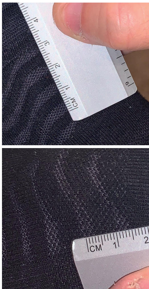
Figura 2. Configuración de ondas plantares en los modelos AWC 1 (arriba) y 2.1 (abajo).

El software asociado dividió la planta del pie en 10 zonas (1.º dedo, dedos menores, de 1.º a 5.º cabeza metatarsiana, medio pie, tacón medial y tacón lateral). La variable analizada fue la presión plantar máxima. Para el análisis estadístico se utilizó la media de las tres