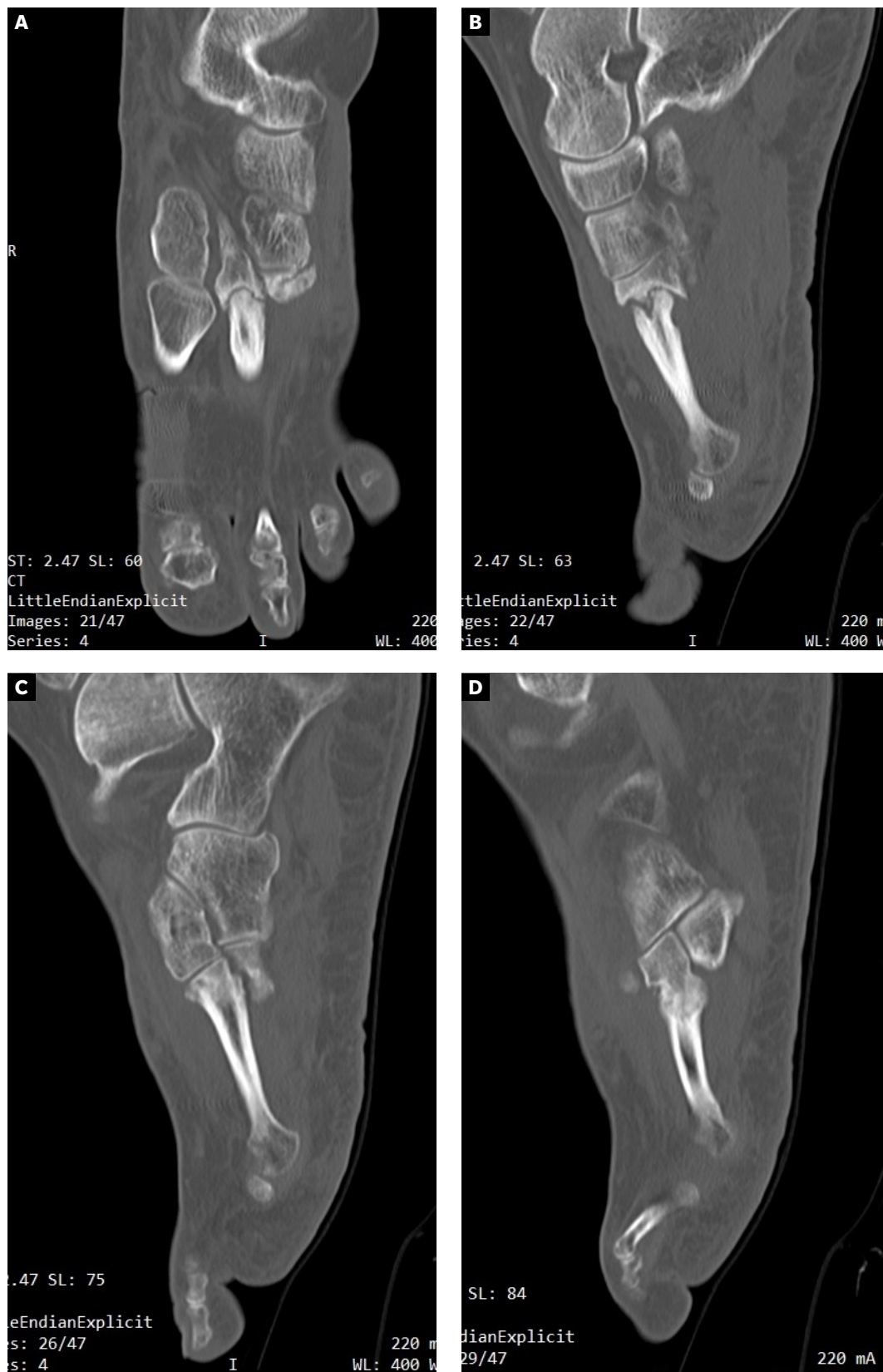
Figura 2. A y B: ausencia de consolidación completa en 2.º metatarsiano compatible con no-uni3n y pseudoartrosis. C: consolidaci3n completa en 3.º metatarsiano. D: no-uni3n con consolidaci3n incompleta del 4.º metatarsiano.